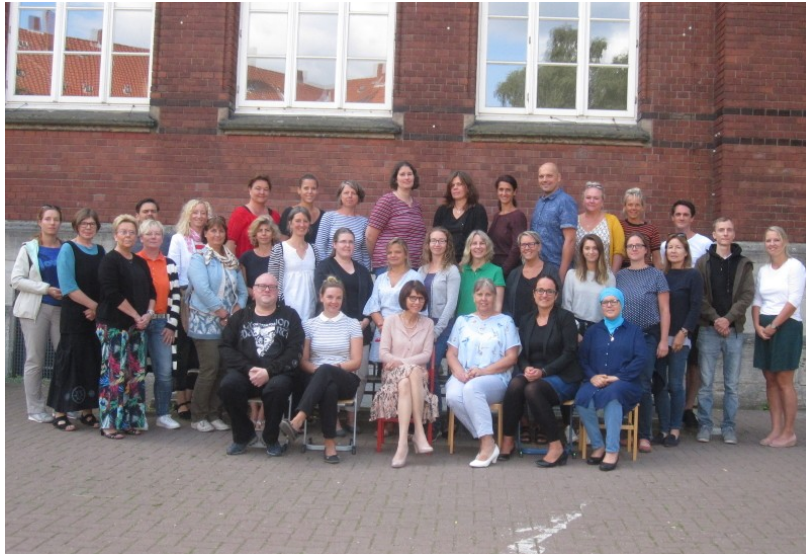
Grund- und Hauptschule Pestalozzistraße