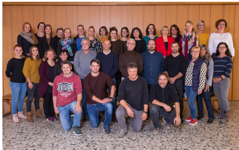
Grund- und Hauptschule Rünigen